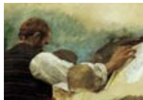
Autoritratto Luigi Nono dipinge all'aperto

t. 0434 72226, utesacile@uniterzaeta.191.it utesacile.blogspot.com